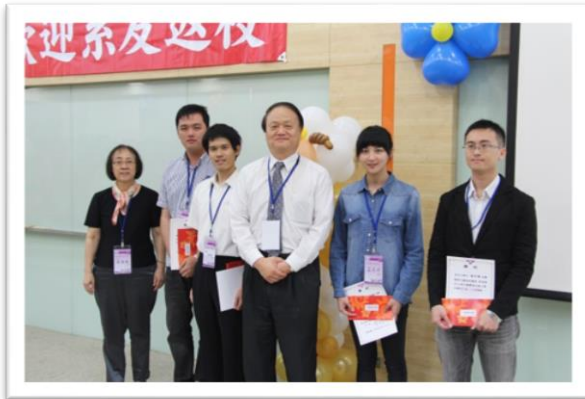
NE74 核工獎學金頒獎儀式

75 級、85 級值年系友與 94 級系友為了回饋母系，特地捐贈可觀的經費，讓系上能夠運用來照顧與鼓勵在學學弟妹學習以及舉辦重要活動。